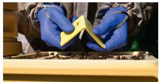
Mini-Plus ½ pro Zarge